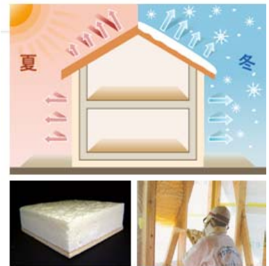
アクアフォームによる施工

高い気密・断熱性をもつKS-Woodは省エネルギー効果が高く、建物の冷暖房に要する光熱費を削減します。断熱性能は、グラスウール(10K)の1.5倍です。