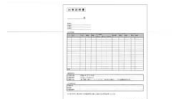
信頼を得る「出荷証明書」を全物件配布します

住む人に優しくあることで、オーナー様の資産としても長く価値を維持できます。また、構造材には安心の「出荷証明書」付き。1本1本検査を行い安心の材料を供給します。